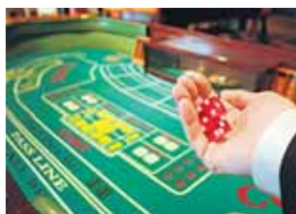
Klare Regeln für die internationalen Finanzmärkte beugen Krisen vor.

Ein wichtiger Schritt, dem jedoch die Umsetzung von international noch auszuhandelnden Regeln für die Finanzmärkte so schnell wie möglich folgen muss“, wie der finanzpolitische Sprecher der SPD-Bundestagsfraktion