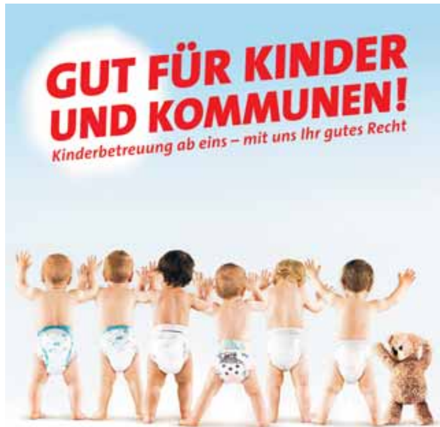
Die SPD-Bundestagsfraktion hat einen Rechtsanspruch auf Kinderbetreuung für alle Kinder ab dem ersten Geburtstag durchgesetzt.

// Vom Elterngeld bis zur Erhöhung des Kindergeldes – ohne das Engagement der SPD-Bundestagsfraktion wären in dieser Legislaturperiode viele Fortschritte in der Familienpolitik nicht möglich gewesen. //