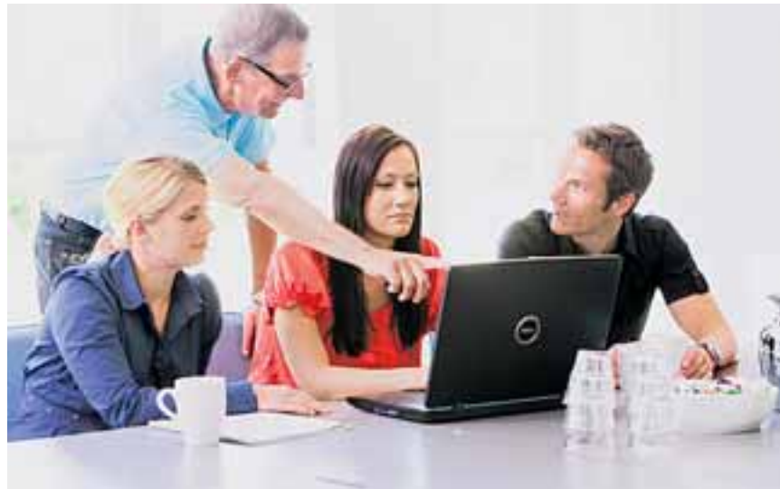
Berufseinsteiger brauchen faire Jobchancen – auch in der Krise. Deshalb soll Altersteilzeit künftig nur dann gefördert werden, wenn der Betrieb einen Auszubildenden einstellt oder einen Ausgebildeten übernimmt.

Die als „staatliche Subventionierung des Personalabbaus“ oft gescholtene Altersteilzeit wirkt im Übrigen viel besser als vermutet. So entfielen 2008 von den gut 100 000 Förderfällen über 50 000 auf junge Leute, die als Azubis eingestellt oder nach ihrer Ausbildung übernommen wurden. Die restliche Förderung entfiel auf Neueinstellungen von Arbeitslosen. „Wir brauchen die geförderte Altersteilzeit