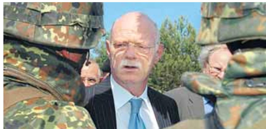
Von 2002 bis 2005 war Peter Struck Bundesminister für Verteidigung. Unter seiner Führung erhielt die Bundeswehr neue verteidigungspolitische Richtlinien.

Gibt es Dinge, bei denen Sie froh sind, wenn Sie damit nichts mehr zu tun haben?