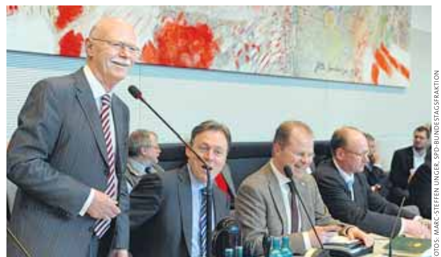
Von 1990 bis 1998 war Peter Struck Parlamentarischer Geschäftsführer der SPD-Bundestagsfraktion, von 1998 bis 2002 und seit 2005 Fraktionsvorsitzender.

Nein. Die Union ist insgeheim immer noch der Meinung: Wirtschaft wird in der Wirtschaft gemacht, und der Staat soll sich raushalten. Die Konjunktur-