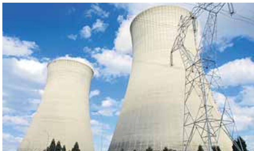
Atomstrom ist weder billig noch klimaschonend.

Da bei Atomkraftwerken die Abwärme ungenutzt bleibt, ist der Wirkungsgrad mit rund 35 Prozent sehr viel geringer als bei Kraftwerken mit Kraft-Wärme-Kopplung – sie bringen es auf satte 90 Prozent.