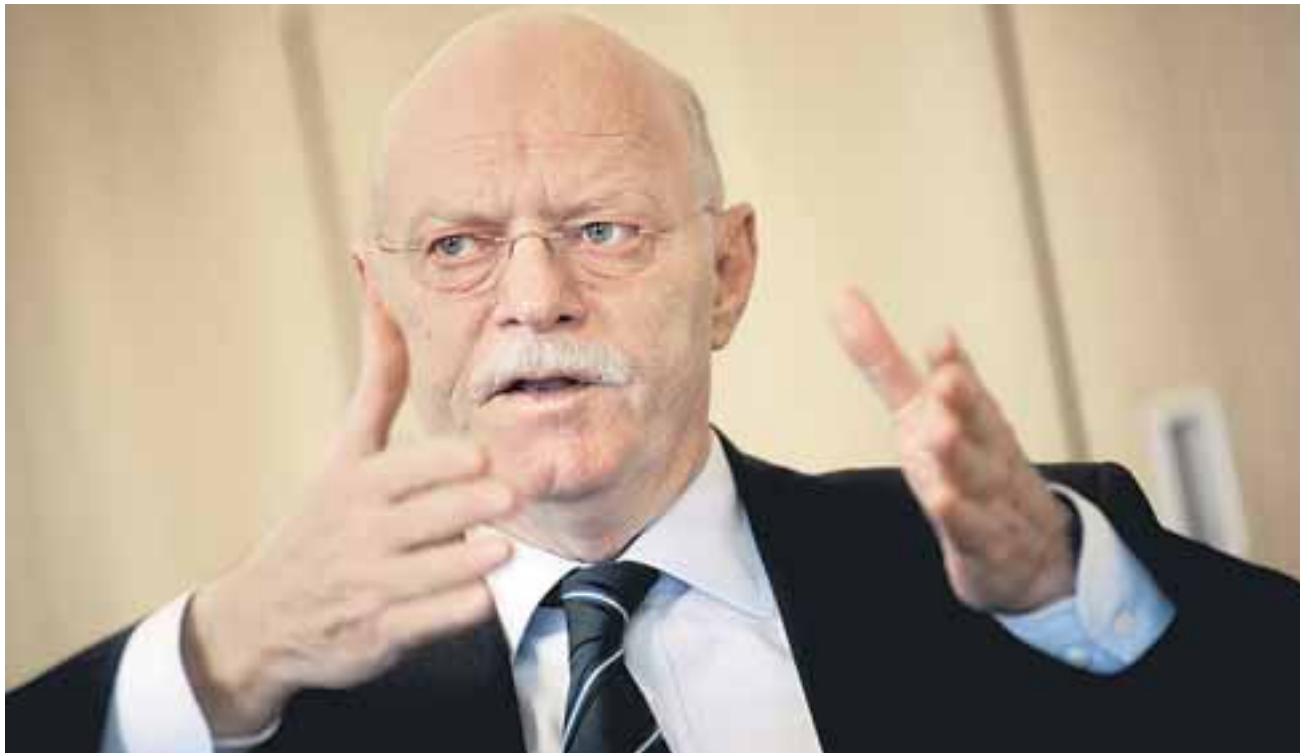
Kein Gesetz verlässt den Bundestag so, wie es hineinkommt. Nicht nur mit dem nach ihm benannten Struckschen Gesetz hat der SPD-Fraktionsvorsitzende den Bundestag mit geprägt.