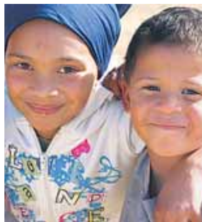
In den Entwicklungsländern werden in Folge der Krise jedes Jahr bis zu 400 000 Kinder zusätzlich sterben.

Doch es geht der SPD-Politikerin nicht allein um Hilfen. Sie mahnt auch institutionelle Schlussfolgerungen aus der Krise an. So sollen die Vereinten Nationen (UN) in Wirtschaftsfragen gestärkt werden. Ein Erfolg in diese Richtung ist die Einrichtung eines „Intergovernmental Panel on Systemic Risks“ auf UN-Ebene, die im Juni in New York beschlossen wurde. Das Beratungsgremium soll Fehlentwicklungen identifizieren und künftige Krisen